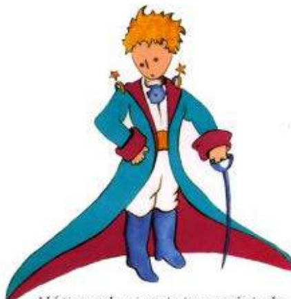
Aquí tienen el mejor retrato que más tarde logré hacer de él

Me puse en pie de un salto como herido por el rayo. Me froté los ojos. Miré a mi alrededor. Vi a un extraordinario muchachito que me miraba gravemente. Ahí tienen el mejor retrato que más tarde logré hacer de él, aunque mi dibujo, ciertamente es menos encantador que el modelo. Pero no es mía la culpa. Las personas mayores me desanimaron de mi carrera de pintor a la edad de seis años y no había aprendido a dibujar otra cosa que boas cerradas y boas abiertas.